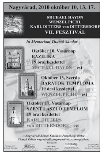
A zenei fesztivál plakátja