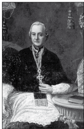
Patachich Ádám püspök

A fesztivál végül is 2004 októberében indult el, több szempont figyelembe véve: egyrészt, mert akkor volt kerek 40 éve, hogy a nagyváradi lakosság nemzeti és felekezeti hovatartozás nélkül, összefogott és megmentette a Szent László templomot a lebontástól –