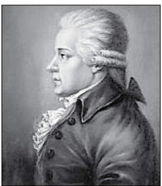
Karl Ditters von Dittersdorf

Mielőtt rátérnénk Dittersdorf (mely M. Haydn-ra is vonatkozik) tartózkodásának ismertetésére, szükséges