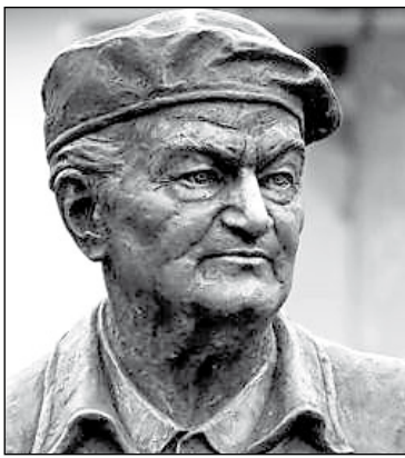
Ruzicskay György festőművész

művészi pályáját, ekkor vette fel a Ruzicskay művésznevet. (Eredeti neve: Ruzicska György.) Tanulmányait Münchenben kezdte, de tanult és alkotott Hollandiában, Franciaországban, Olaszországban, az USA-ban és Kanadában is. 1960-ban szülővárosa az Erzsébet-ligetben alkotóházat bocsátott rendelkezésére, így attól kezdve nyarait ott töltötte. Szarvas-Budapest-Párizs háromszögben élt és alkotott.