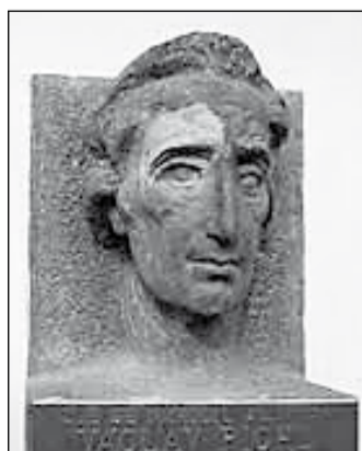
Wenzel Pichl szobra

főherceg zenekarában lesz hegedűs, és kamarazene szerző. Ott közel 20 évet dolgozott, és itt teljesedett ki zeneszerzői munkássága. Levelező kapcsolatban állt Giovanni B. Martini-vel, akit valóságos csodált. P.Nardini neki ajánlotta a "Cento variazioni per il violino" c. művét. 1779-ben a Mantuai-i Accademia Filharmonia, majd 1782-ben a Bologna-i tagjai közé választotta. Miután Lombardiát a francia csapatok elfoglalták, visszatér Bécsbe 1796-ban. Sajnos, a Milanóból való menekülése közben, több szerzeménye, kottagyűjteménye