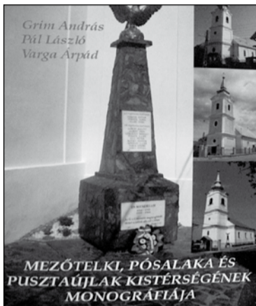
A kötet címlapja

Külön figyelmet érdemlő része a monográfiának a