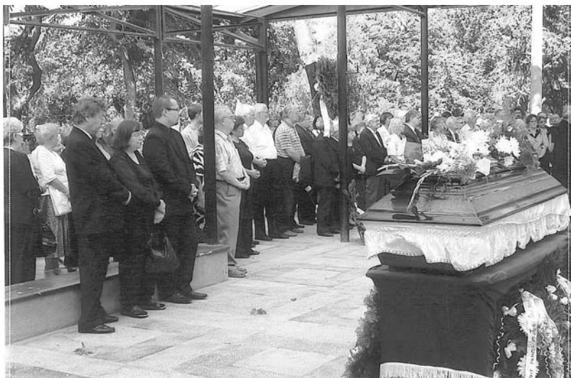
Temetés - 2009. szeptember 21.