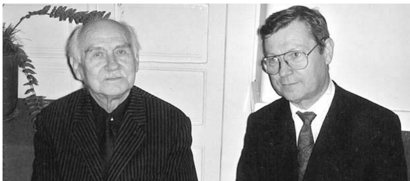
Apa és fia